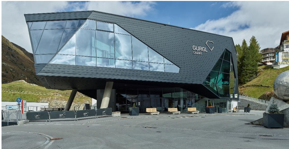
Abbildung 1: Hauptgebäude Gurgl Carat