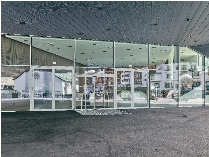
Abbildung 2: Eingang mit automatischer Schiebetüre ins Gurgl Carat

Das Gebäude ist schwellen- und rampenfrei. Lediglich die Bühne hat eine Rampe zur Aufstiegshilfe. Falls diese benötigt wird, bitte wir um rechtzeitige Bekanntgabe.